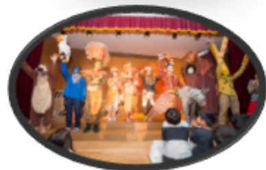
クリスマス会：先生たちのライオンキング