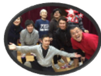
元気な男性職員といっぱい遊べるよ サッカー、ダンス得意な先生がいるよ