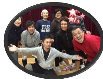
元気な男性職員といっぱい遊べるよ サッカー、ダンス得意な先生がいるよ