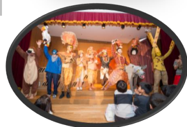
クリスマス会：先生たちのライオンキング