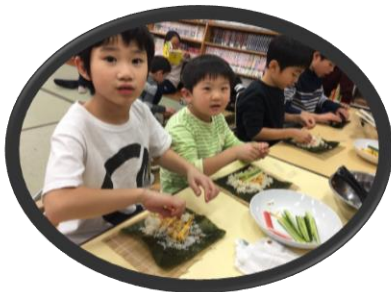
節分には恵方巻を作ったりするよ