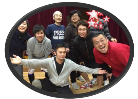
元気な男性職員といっぱい遊べるよ サッカー、ダンス特異な先生がいるよ