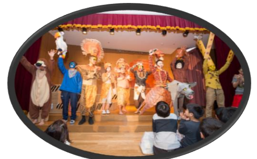
クリスマス会：先生たちのライオンキング