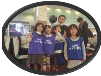
ボーリングや、映画、劇団 四季の遠足もあるよ。